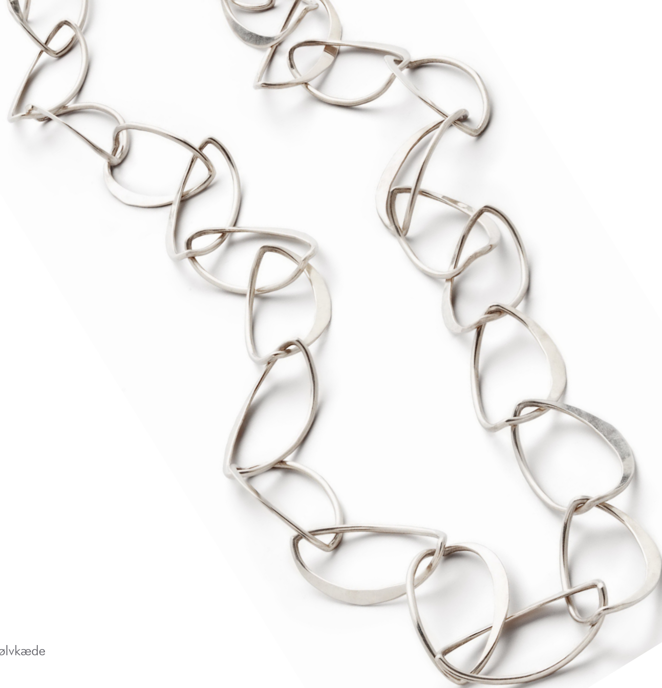
“Smedede Robåde”, sølvkæde