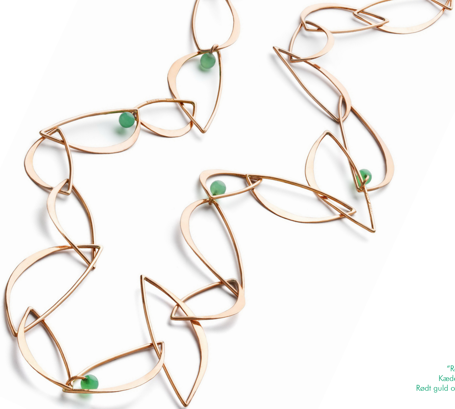
“Rød og Grøn”. Kæde med 5 låse. Rødt guld og chrysopras.