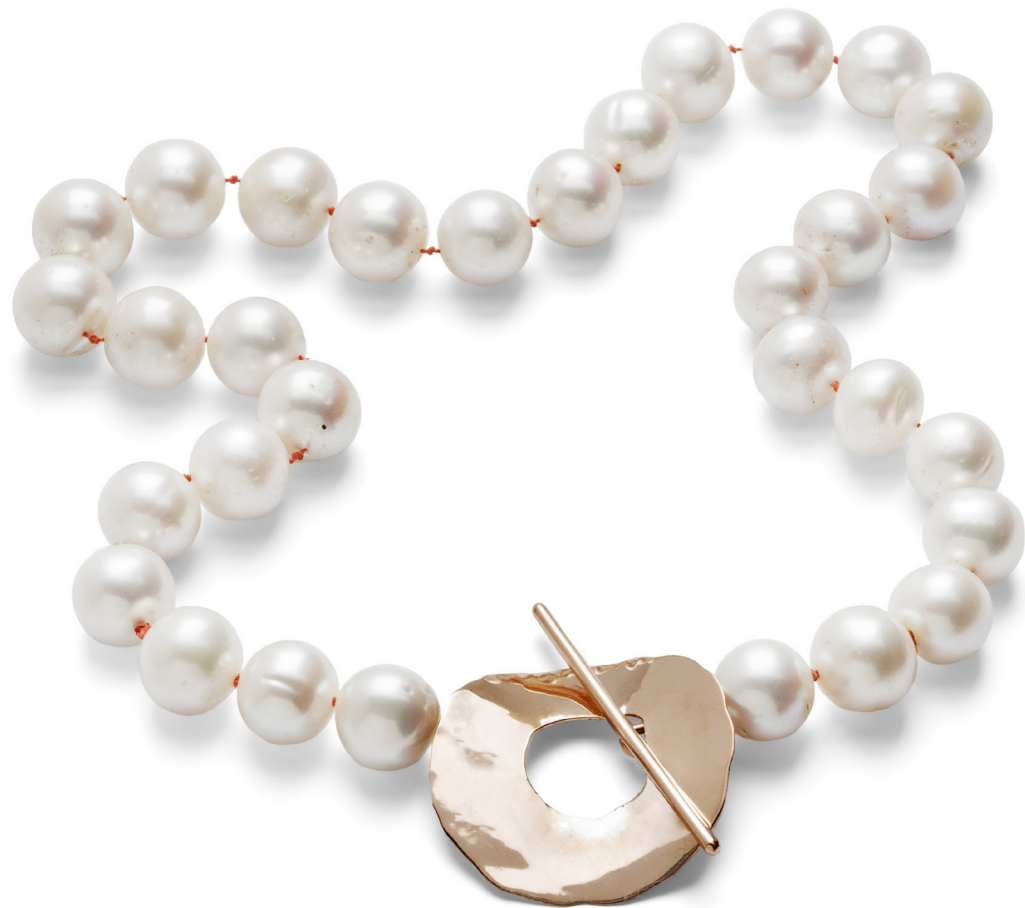
"Rød Sollås", 1990.