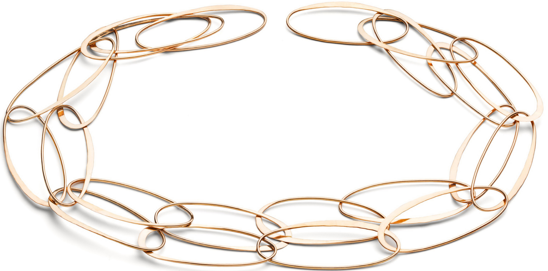
"RED OVALS". Forged goldchain. The links are long and oval on two of this year's chains. One is silver, the other gold. At first glance, the links are similar, but upon a closer look, the chain is about each original oval having been prolonged by the unique forging. Each oval stands symmetrically in the inner silhouette while the forging draws out a new oval, in dialogue with the original.