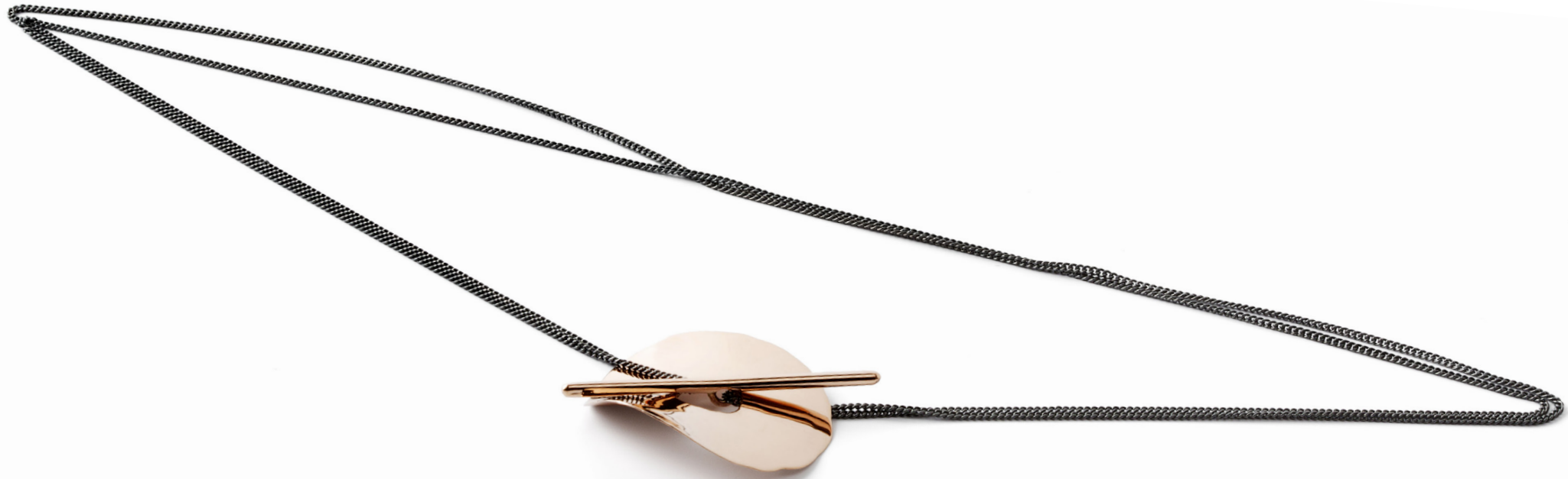
"Rød Sollås", 1990.