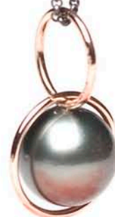
Perle-vedhæng, rødt guld, sort perle og sølvkæde. 2008.