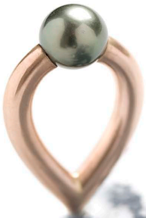
"Dråben", perlering. 2008. "The Drop" – ring with pearl. 2008.