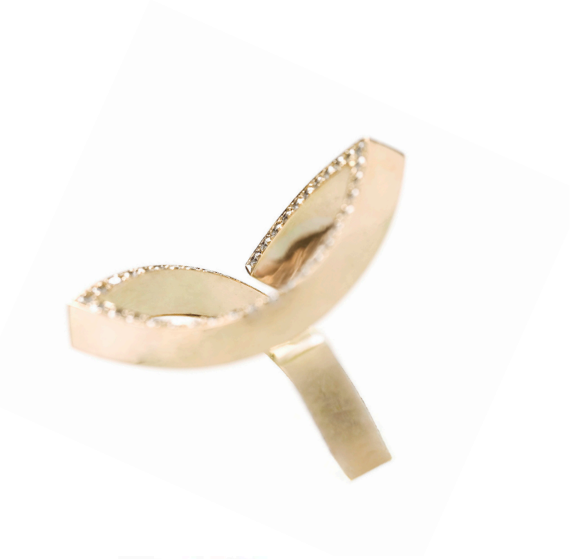
"3'eren" , ring i rødt guld med blå og hvide diananter. 2008.