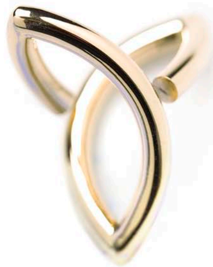
"Rund 3'er", ring i rødt grønlandsk guld. 2008.