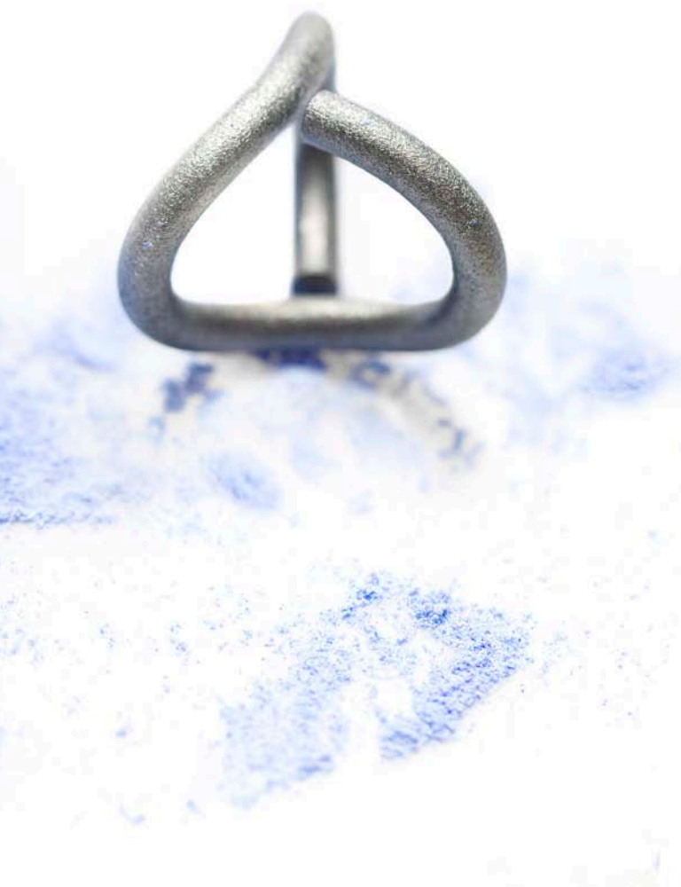
"Rund 3'er", ring i matsort sølv. 2008.