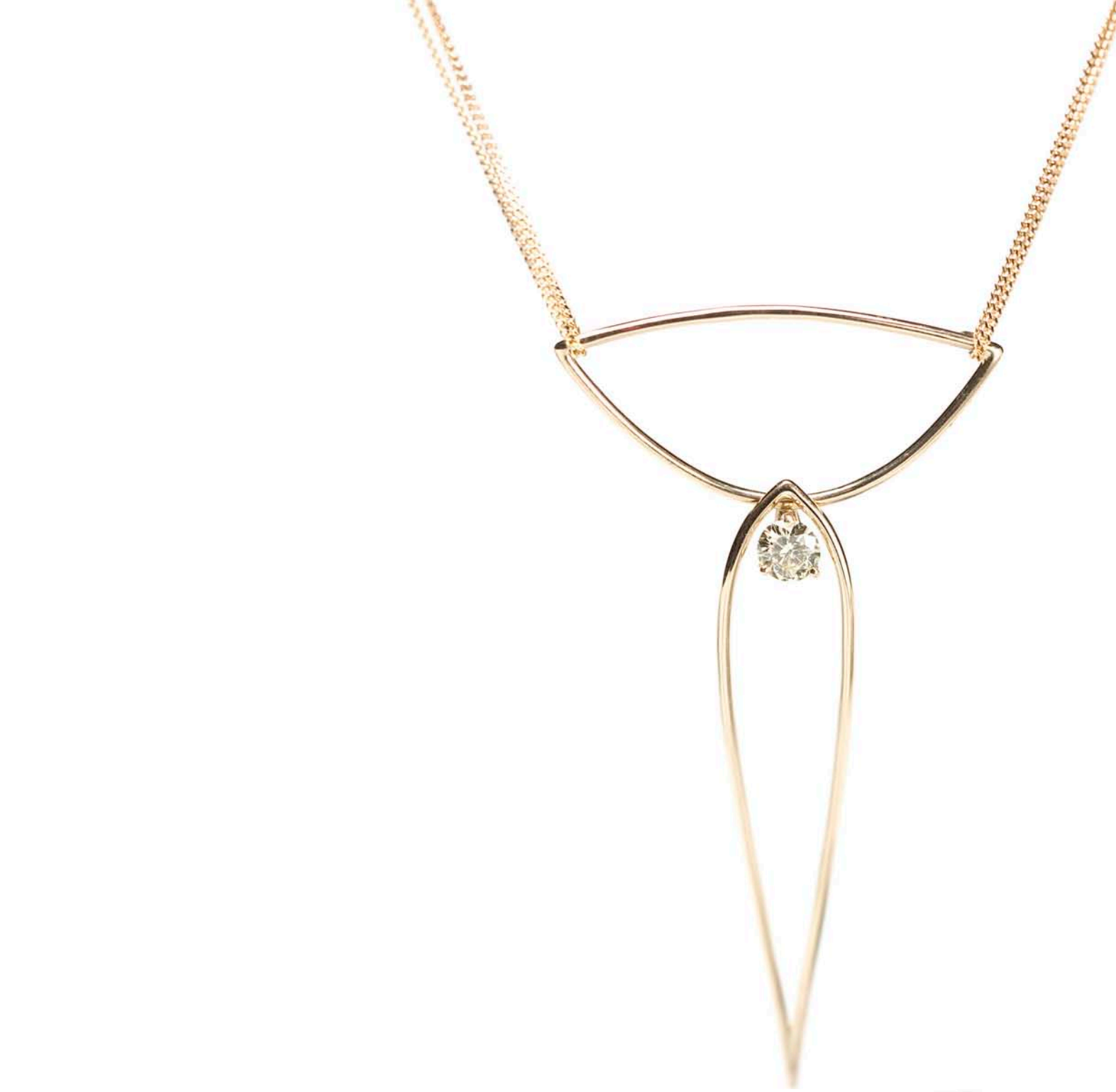
"Nikkende Halssmykke", gult guld med gul diamant. 2008.