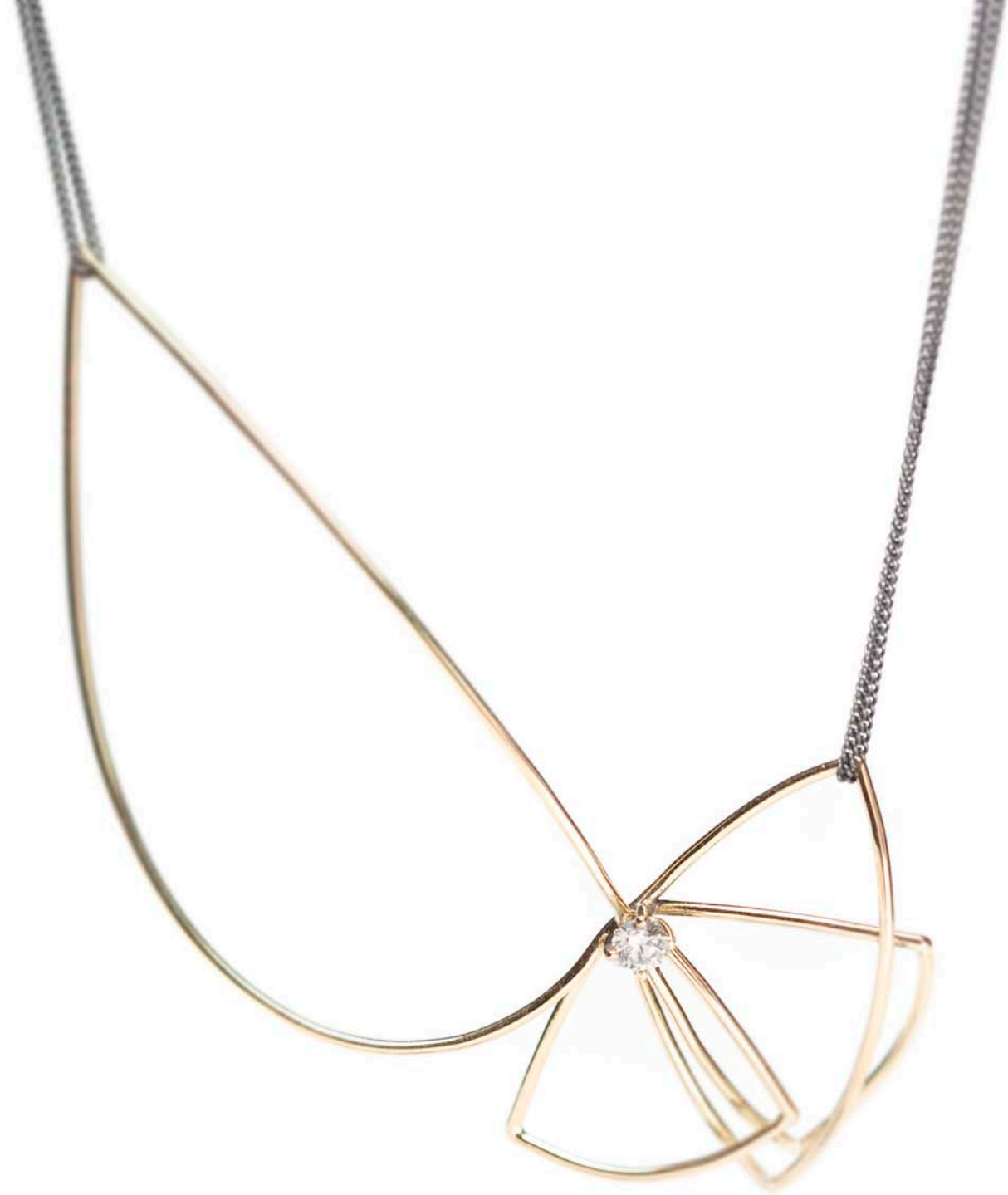
"Slørhale", halssmykke i guld med diamant og matsort sølvkæde. 2008.