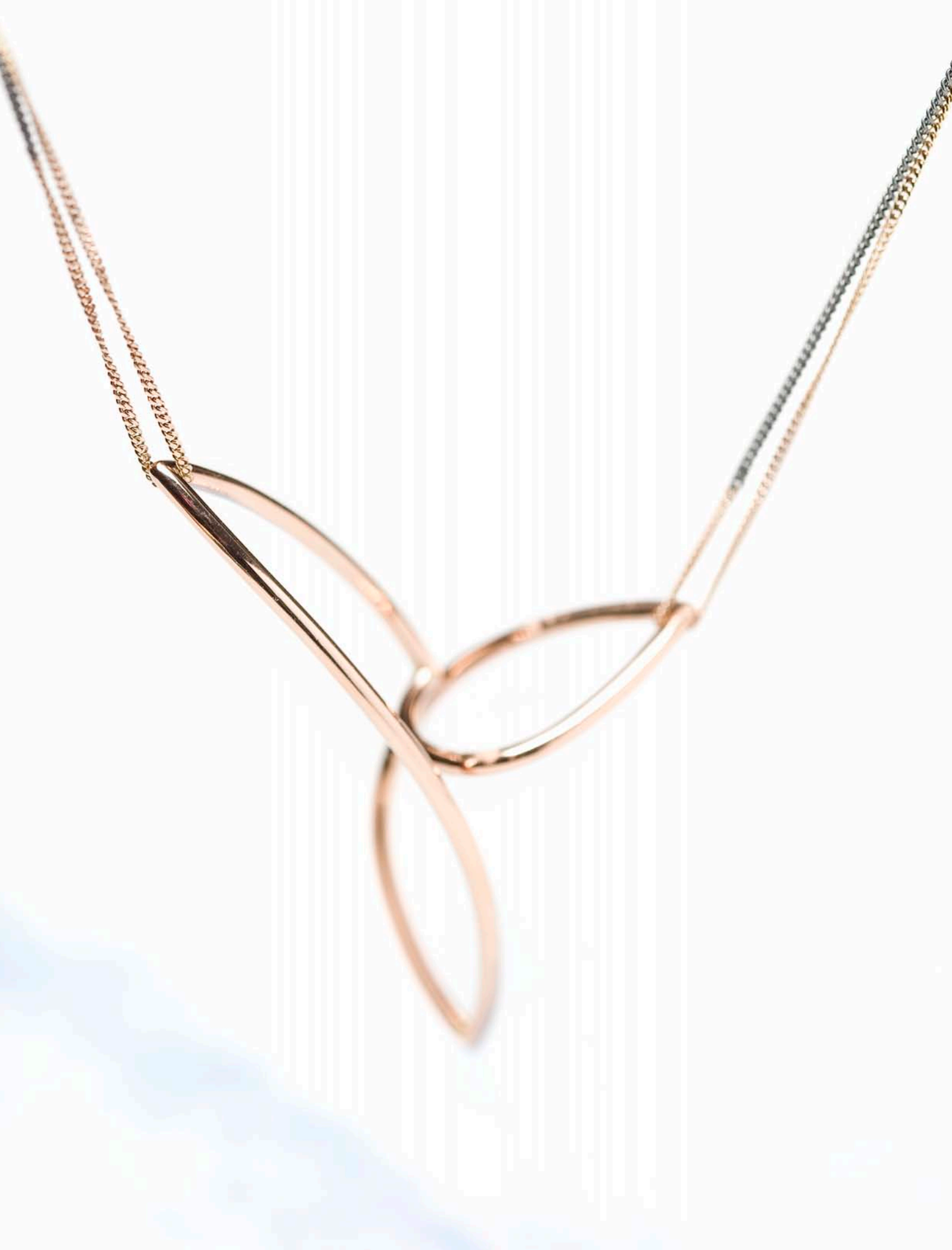
Ringen "Kajak" som halssmykke i rødt guld. 2008.