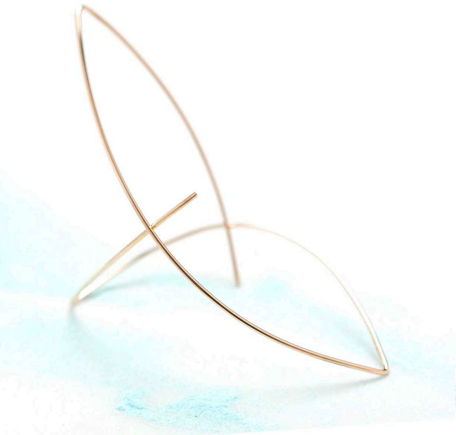
"Kajak" - fjedrende armbånd i rødt guld. 2008.