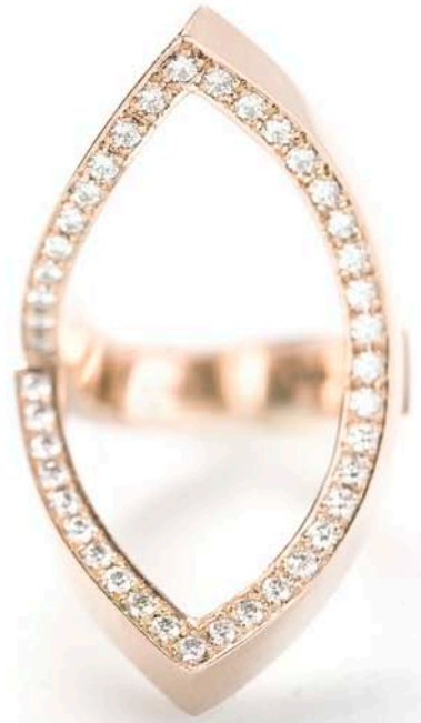
"Thrice Over" – ring in red gold with white and blue diananter. 2008.