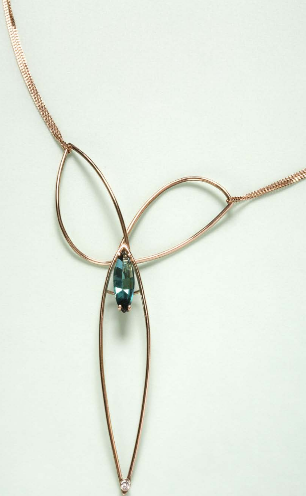
"Rød Kanin", halssmykke i rødt guld med turmalin og diamant. 2007. "Red Rabbit", necklace in red gold with tourmaline and diamond. 2007.