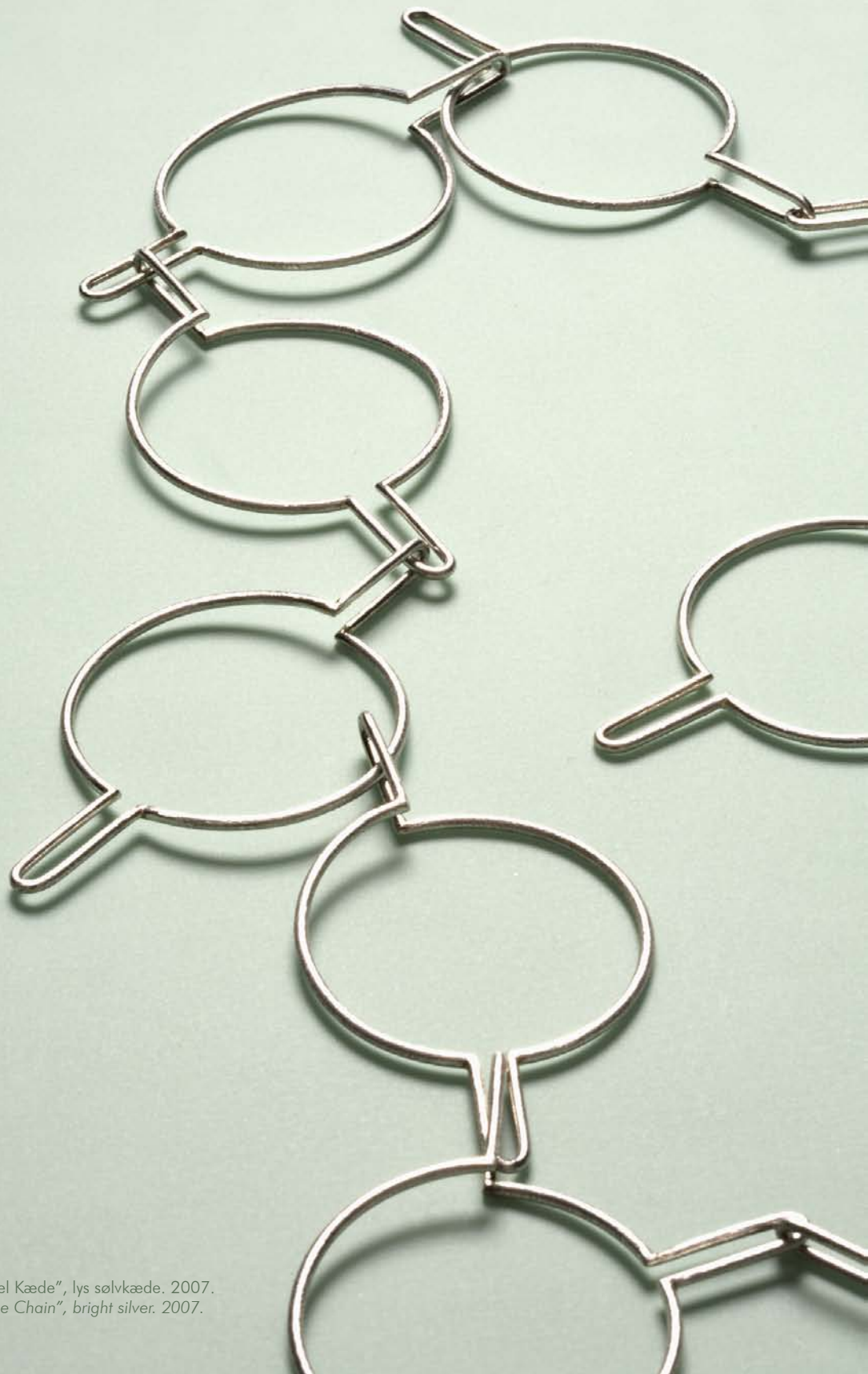
"Cirkel Kæde", lys sølvkæde. 2007. "Circle Chain", bright silver. 2007.