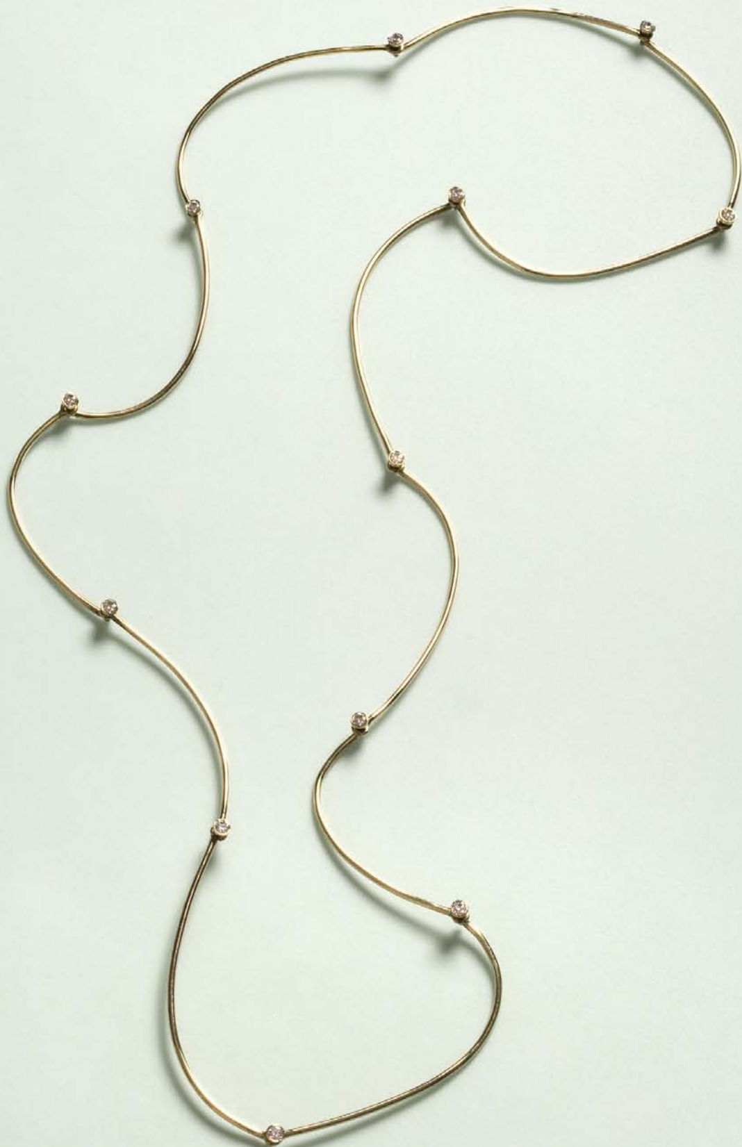
"River", kæden, som startede tankerne omkring de uens led. Guld og diamanter. 2005. "River", the chain which initiated my thinking of different links. Gold and diamonds. 2005.