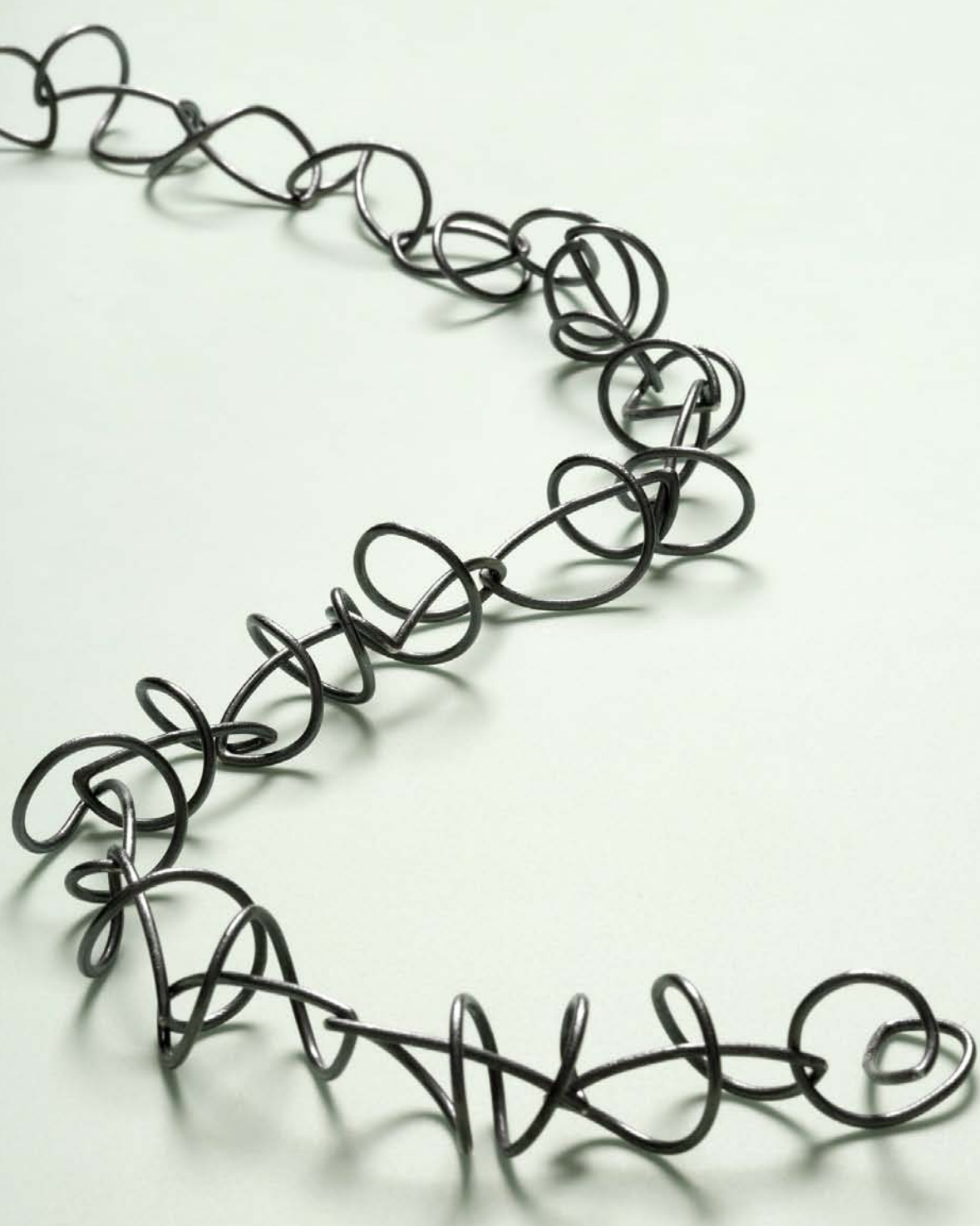
Matsort sølvkæde. 1992. Black silverchain. 1992.