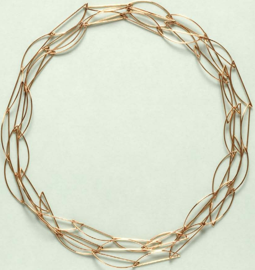
"D-Kæde", blondelignende rødgulds-kæde, der kan bæres lagt to eller tre gange om halsen. 1994. "D-Chain", a lacy red gold chain which can be draped two or three times around your neck. 1994.