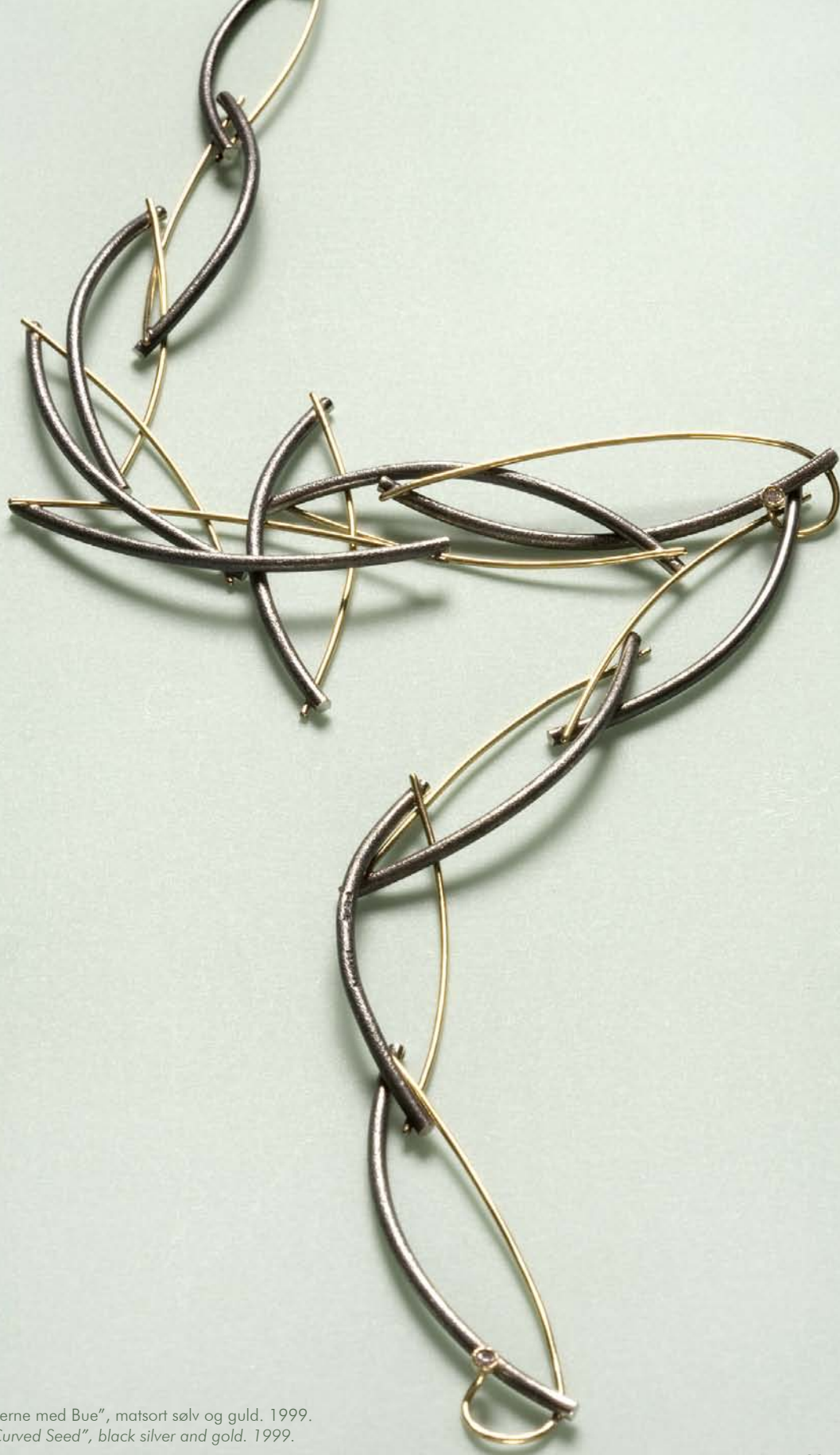
"Kerne med Bue", matsort sølv og guld. 1999. "Curved Seed", black silver and gold. 1999.