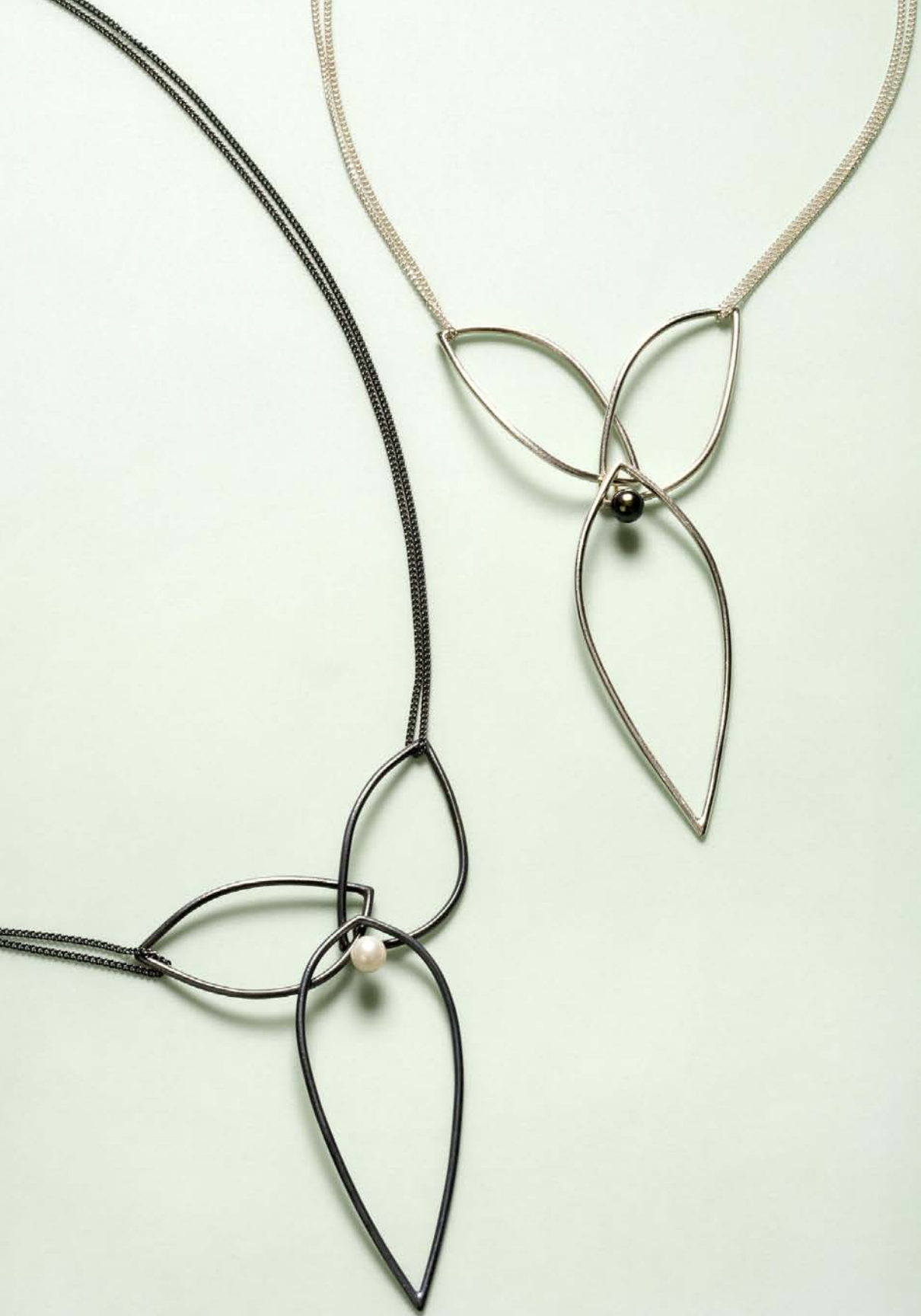
"Sort Kanin" og "Hvid Kanin". Hals Smykker i sølv med perler. 2007. "Black Rabbit" and "White Rabbit". Necklaces in silver with pearls. 2007.