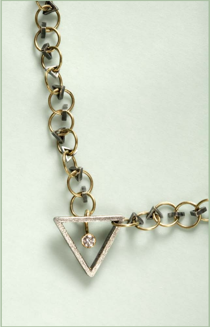
"Kamma Kæde", 1+1=3, detalje. "Kamma Chain", 1+1=3, detail.