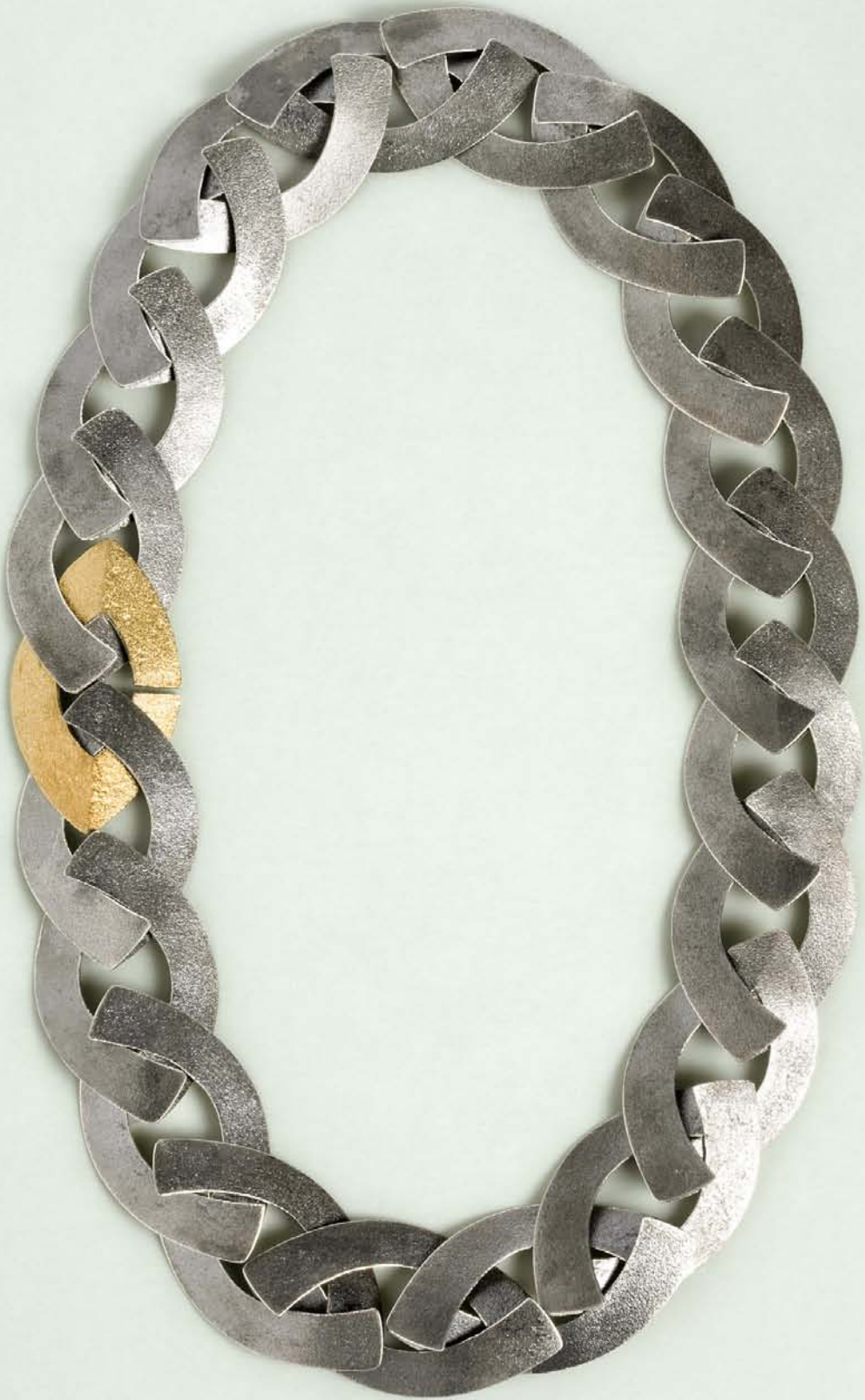
"Bølgekæde", matsort sølv og finguld. 2003. "Chain of Waves", black silver og finegold. 2003.