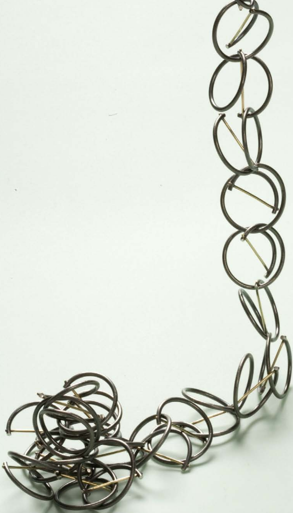
"Kæde af Åbne Evigheder", styrket med en tynd guldtråd. Erhvervet af Statens Kunstfond 1992. "Chain of Open Eternities", strengthened with a tiny goldthread. Acquired by The Danish Arts Foundation 1992.