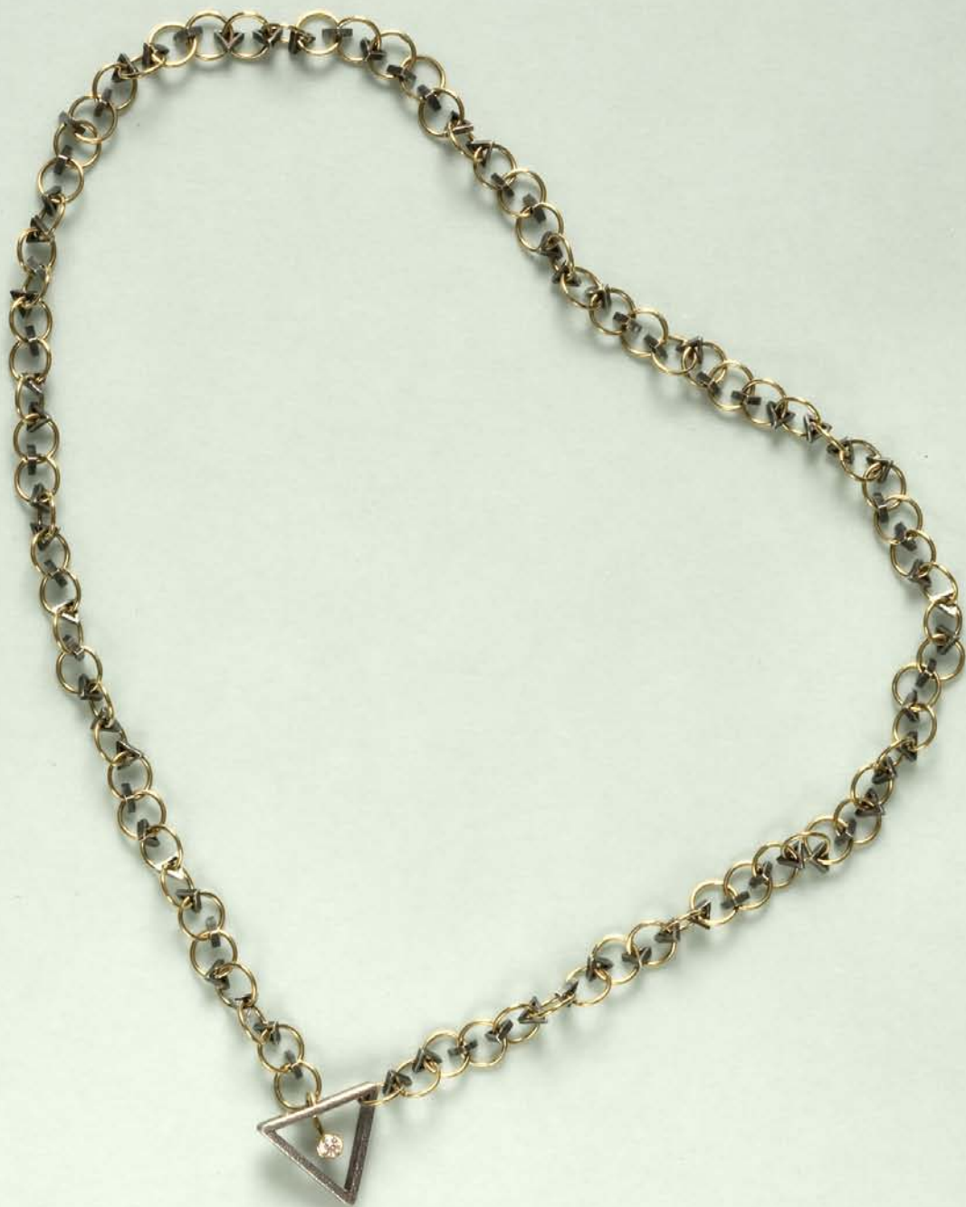
"Kamma Kæde", guld, matsort sølv og diamant. 1991. "Kamma Chain", gold, black silver and diamond. 1991.