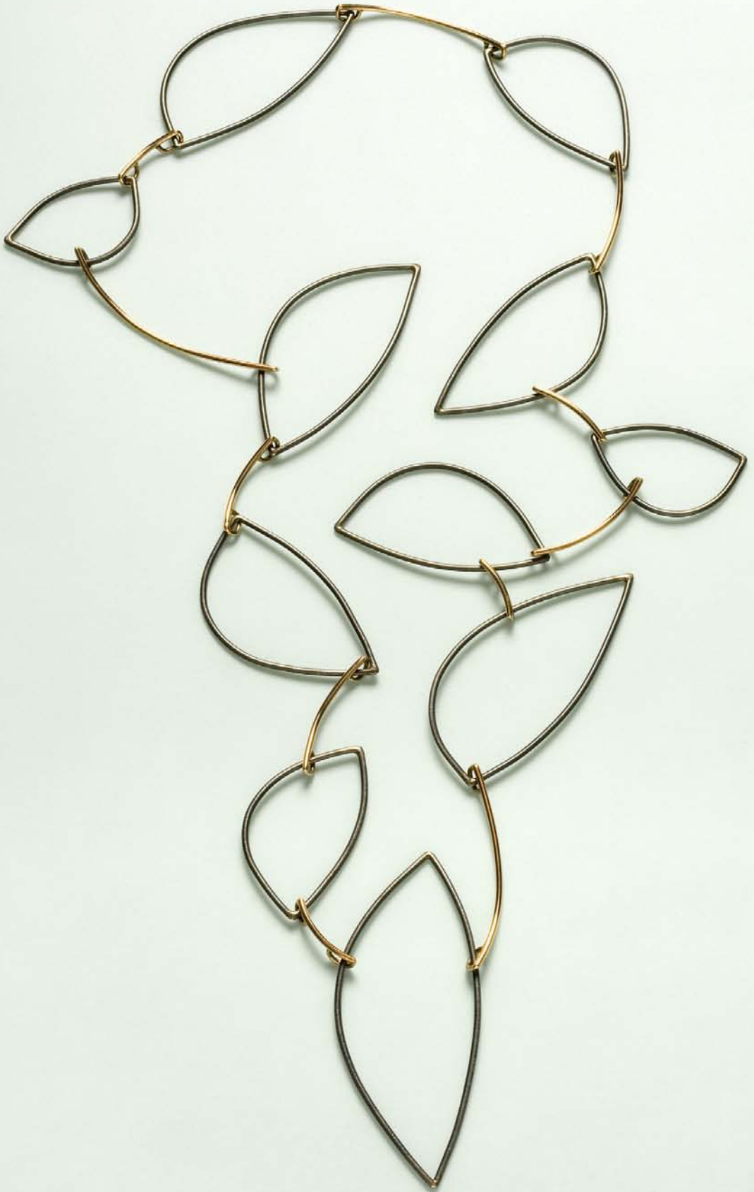
"Mørkt Løv", matsort sølv og rødt guld. 2007. "Dark Leaves", black silver and red gold. 2007.