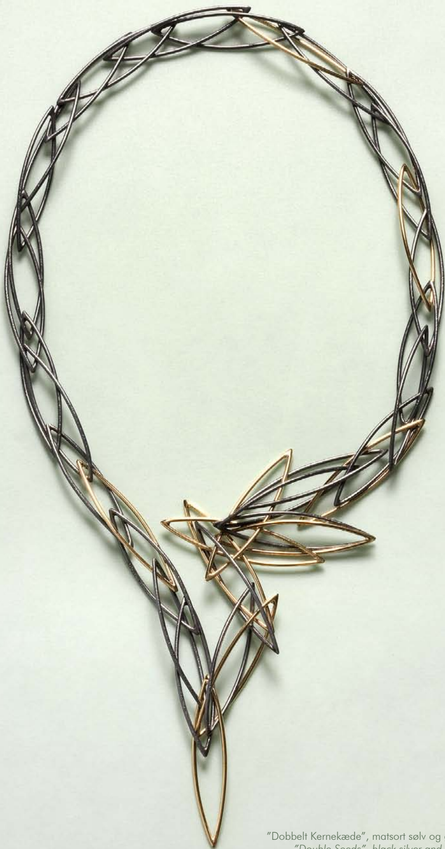
"Dobbelt Kernetkæde", matsort sølv og guld. 1997. "Double Seeds", black silver and gold. 1997.