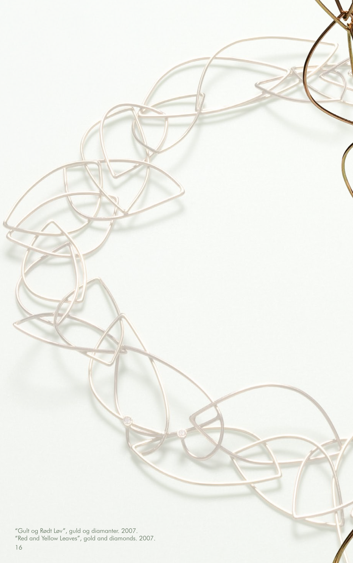
"Gult og Rødt Løv", guld og diamanter. 2007. "Red and Yellow Leaves", gold and diamonds. 2007.