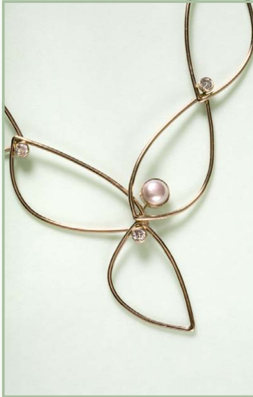
Kæden "Rødt Løv" afkortet et led og den første lille "Kanin" ser dagens lys. 2007. "Red Leaves" shortened by a link. Side 10: "Rødt Løv", rødt guld, perle og diamanter. 2007. "Red Leaves", red gold, pearl and diamonds.