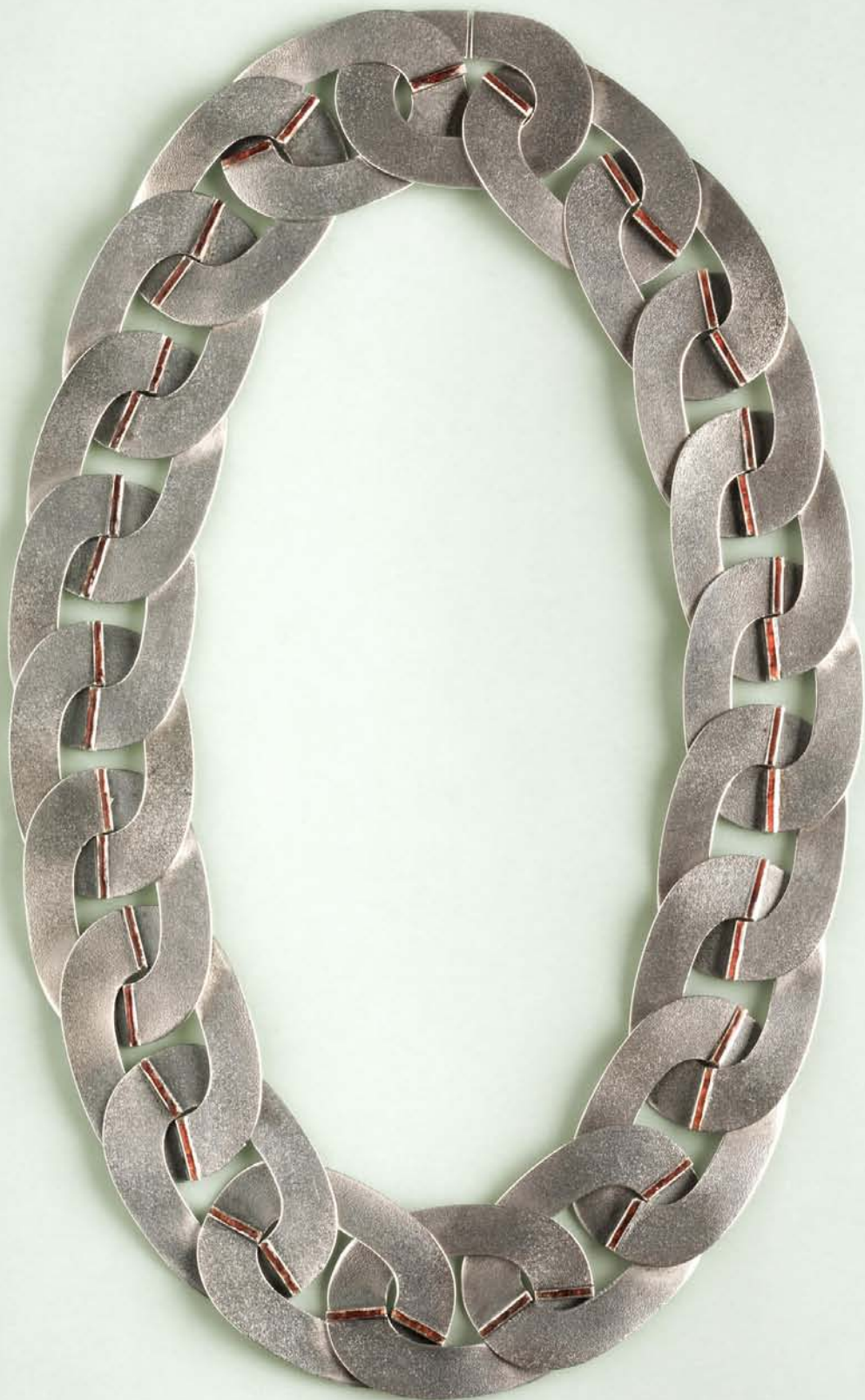
"Gløderne fra Endos Bål", gråt sølv og emalje. Ideen er inspireret af Toshikazu Endos installation i udstillingsbygningen Charlottenborg samme år. 1993. "The Glow of Endo's Fire", gray silver and enamel.