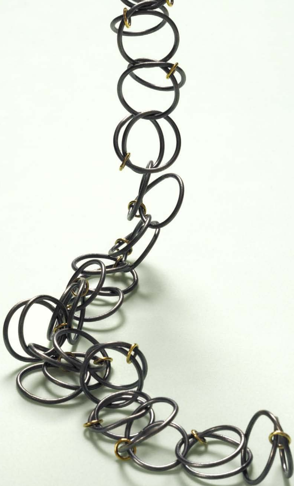
"Kæde af Evigheder", matsort sølv og guld. 1992. "Chain of Eternities", black silver and gold. 1992.