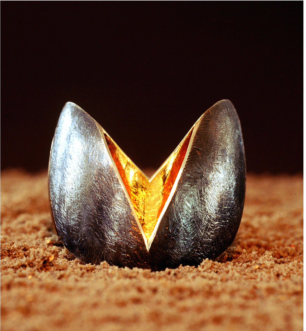
“HJORTESPOR” , silkearmbånd i matsort sølv og finguld, 2001.