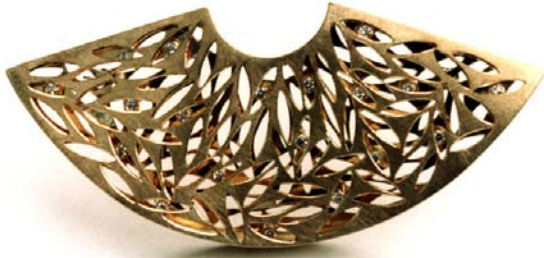
"Se min Kjole", broche guld og diamanter, 1996.