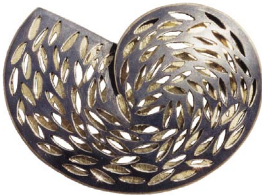
"Konkylie", sølv og bladguld, 1996.