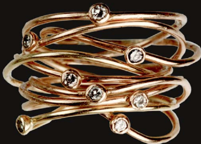
"Legering", guld og diamanter, 1995.

Et klassisk tema indenfor guldsmederi er håndteringen af tynd rund tråd. Næsten som broarkitekten, kan guldsmeden frembringe stor styrke ved hjælp af de tynde konstruktioner. Når jeg "tænker i tråd" bliver udtrykket let og spontant. Skitserne opstår overalt i konturer af hvad jeg ser, i en blyantsstreg eller i legen med i f.eks blomstertråd. I min verden går trådsmykkerne på tværs gennem alle årene, og knytter sig ikke særskilt til de forskellige epoker jeg ellers har arbejdet i.