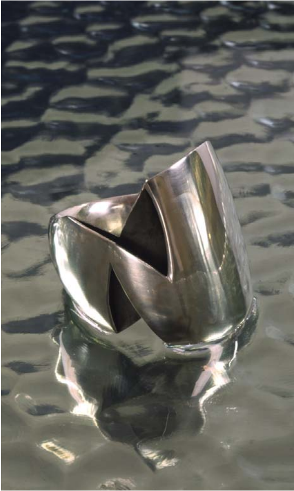
Asymmetrisk Sølvring. Oktober 2000.