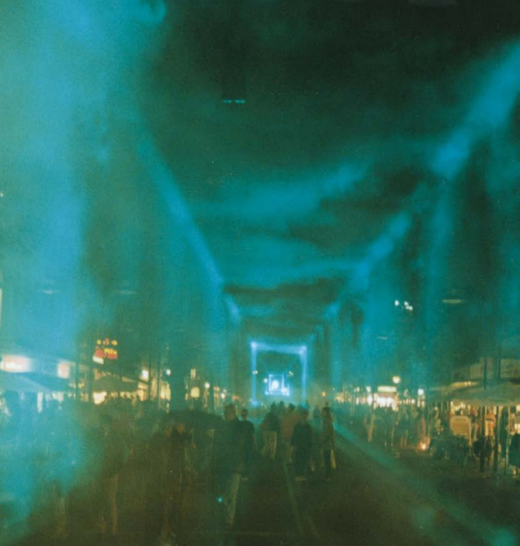
"Grøn Lasertunnel", 1997.

Under afsøgningen af grænserne for et smykke, opstod der i 1997 en unik mulighed for mig til at skabe et "smykke til min by". I en kulturnats aftendunkelhed, blev Lyngby Hovedgade lukket af for trafik, og fra hver ende af gaden lyste en grøn laserstråle, afskærmet sådan, at de begge tegnede et kvadrat på ca. 5 gange 5 meter. Over lang tid, ca. 45 minutter, bevægede læserstrålen sig fra lodret stilling til vandret, hvor de mødtes i det centrale kryds i byen som en mægtig grøn byport, for derefter langsomt at bevæge sig mod himmelhvælvet igen. På fotograf Farrokh Y-Beiks foto fornemmer man klart hvordan lyset flygtigt smykkede byen.