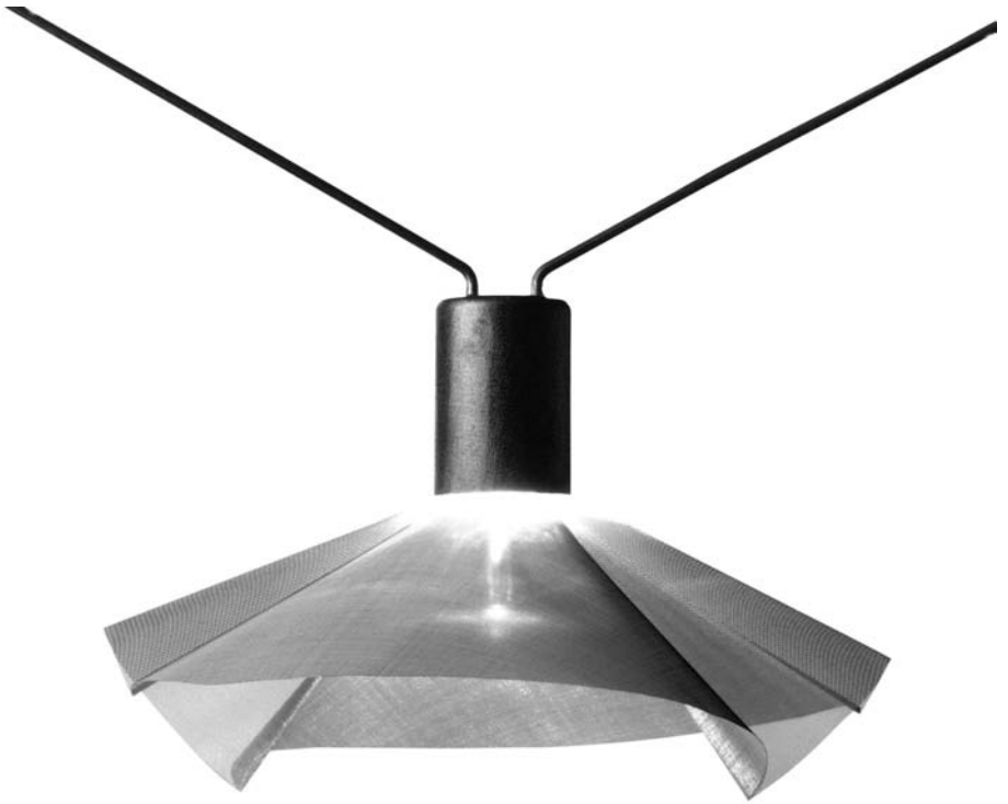
Lampe, sølv med stålskørt. 1995.

I 1995 besluttede jeg at ombygge min værkstedsbutik, og fik derved lejlighed til at tænke over belysning både i den korsformede montage (efter ide af lysearkitekt Gunvor Hansen) og generelt i butikken. Lampe i sølv med stålskørt er tegnet og udført til dette formål.