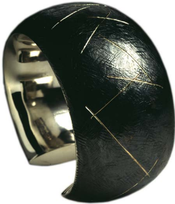
"Matsort med Glimt", armring, sølv og finguld, 1994.