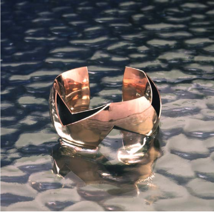
"Boomerang", rødt guld. September 2000.