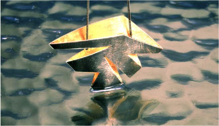
"Vasebroche med gule kløfter", Halssmykke i sort sølv og finguld. September 2000.

Da jeg i 1995 begyndte at lægge bladguld ind i "Høstsmykkerne", var udtryksformen ganske let og poetisk, næsten som blonder. Her i år 2000 har jeg erstattet bladguldet med tykkere finguldsplader, som giver en næsten fluorescerende gul farve i kontrast til det sorte sølv, og smykkerne er generelt blevet kraftigere, næsten korpusagtige.