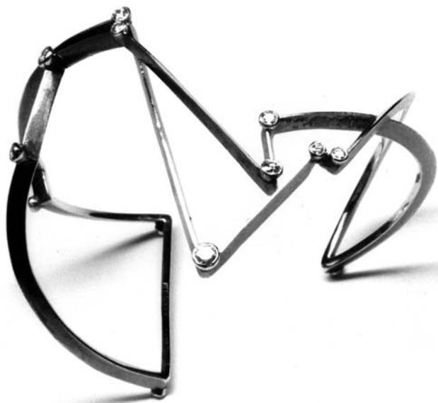
"Nattens Armbånd", guld og diamanter, 1990.

Fra 1990 til 1995 var det nattehimmelens atmosfære der "tegnede" smykkerne. Florlette, sorte guldtråde, i snit som en kniv, skrabet klar ind til guldet, i tynde linier fra punkt til punkt.