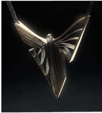
"Rød "Engel", halssmykke, rødt guld, 1985.