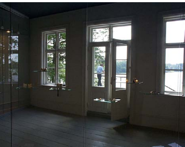
Norske Huset, Sophienholm, Juni 2000. Stemningsbilleder.