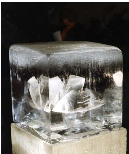
"TØBRUD ", smykker i is. 1993. Isen på billede indeholder to "Vuggevaser" i sølv.

Det at have et udstillings projekt liggende foran sig er et bal: Tankerne svirrer som en lille bi i en, og mange beslutninger skal tages, for at eventyret bliver spændende. Først smykkerne – dernæst iscene- sættelsen. Og netop i december 1993 op til mit 20 års jubilæum, afprøvede jeg for første gang hvad det ville sige at afholde en smykkeudstilling udendørs. I stedet for montre i klassisk forstand, havde jeg indstøbt smykkerne i iskuber 30 cm - 30 cm - 30cm. Tilblivelsen af isen varede flere måneder, og kuberne blev opbevaret i nøje kontrollerede fryser, sådan at monterne kunne klare at blive taget ud i vejrliget uanset om temperaturen var over eller under 0 grader. Da lyssætningen af denne vinterudstilling kom fra soklernes indre, ville iskuberne under alle omstændigheder smelte nedefra i løbet af ikke særlig mange timer, så begivenheden "Tøbrud", varede derfor kun en enkelt dag.