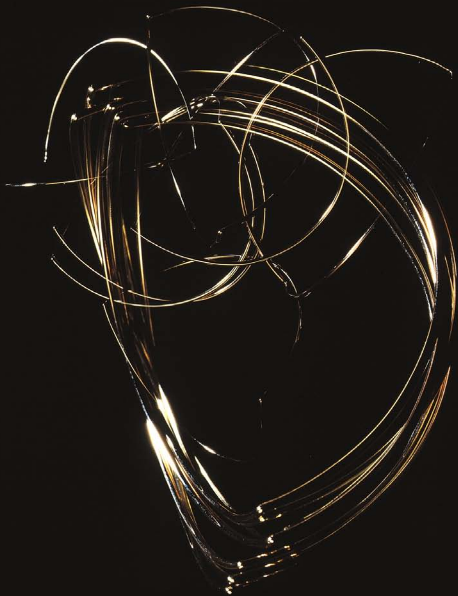
"Bådarmbånd", guld, 1993.