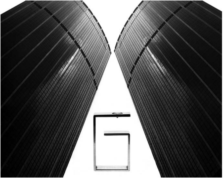
Første diamantring. Hvidguld. 1975.