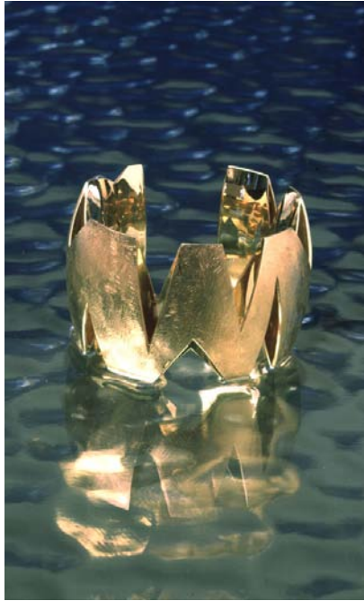
"Kongen", silkearmbånd i guld. 2000.