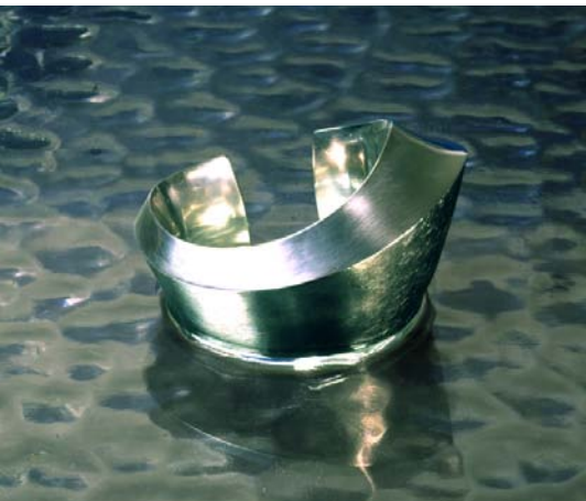
"Kutter", Sølvarmbånd. September 2000