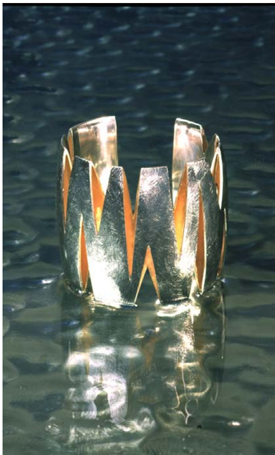
"Dronningen", armbånd i sølv og finguld. April 2000.