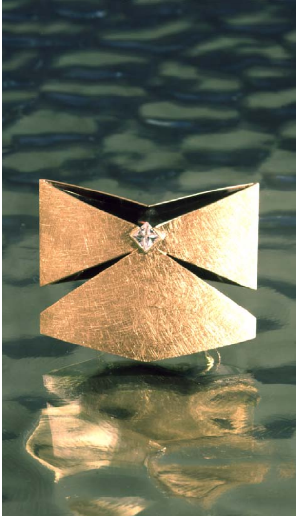
"Gul Butterfly", Broche, gult guld og diamant, April 2000.

År 2000 har været brochernes år, og grundideen har kredset omkring åbne hule former. Med tanke for at man kunne stikke en blomst i sin broche på en særlig dejlig dag, blev formen skabt nær vasens og kurvens linier. Guldbroche med regnbue og princess-cut diamant.