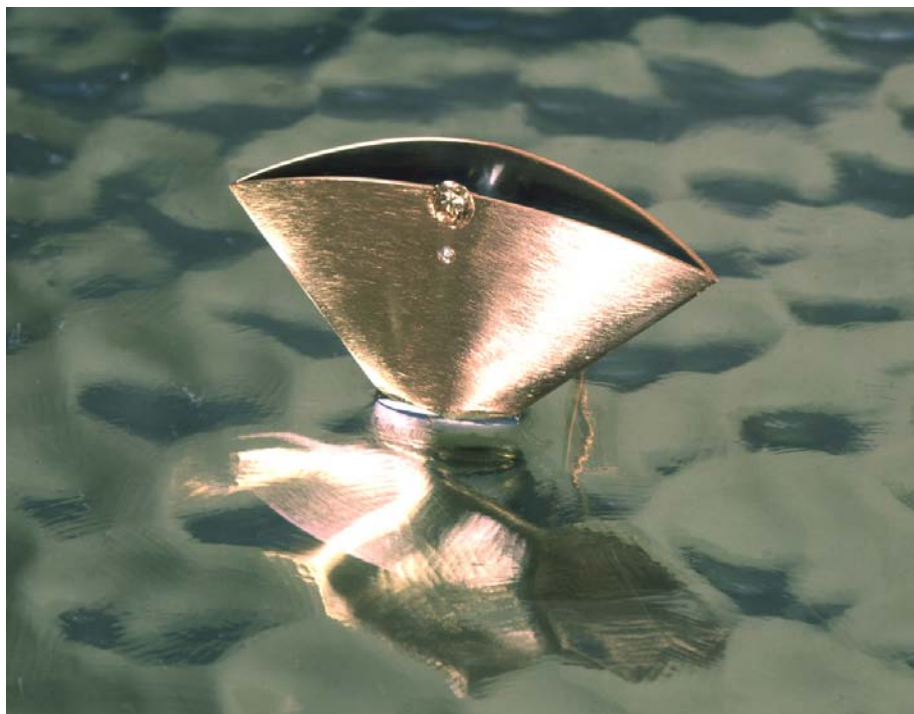
"Kurv med Frugt". Broche i rødt guld med rødlig diamant og lille stjerne. Maj 2000.